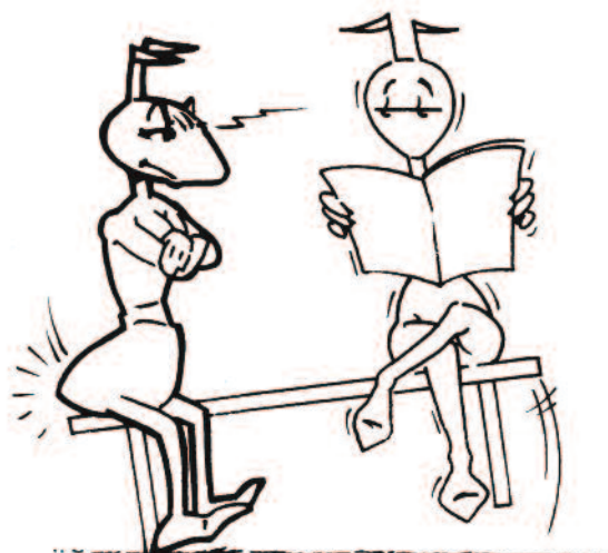
Comportement en "tête à tête"

Ce retour à l'unité passe par la reconnaissance de son profil dominant. Il s'agit d'apprendre à nommer mes schémas répétitifs à caractère cognitif et affectif, qui m'entraînent à être trop réactif par rapport à mon environnement. Une fois que j'ai pris acte de ma compulsion dominante, alors je peux progressivement prendre mes distances, renoncer à mon schéma automatique, et essayer d'utiliser des facettes de moi-même plus appropriées et plus justes. C'est une pratique quotidienne, semblable à celle de la méditation, que nous appelons " Développer l'observateur intérieur ". Il s'agit de constater de plus en plus tôt si je suis centré ou si je ne le suis pas, considérant qu'être centré, c'est vivre l'unité, ne serait-ce qu'un instant.