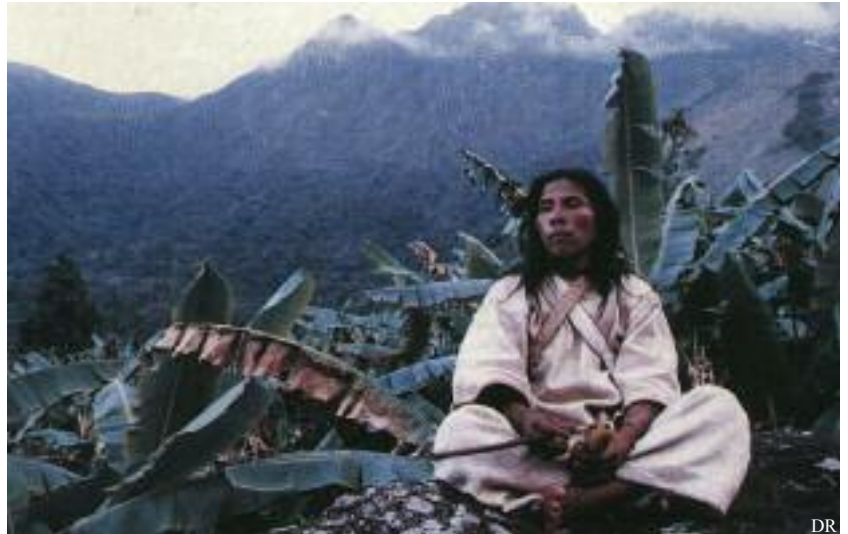
Les indiens Kogis : un peuple traditionnel

Biologie Totale) ont abandonné tout autre traitement que la prise en charge psychothérapeutique, convaincus de guérir de leur cancer par la seule résolution d'un conflit psychologique supposé à l'origine de leur pathologie. Arrivés à la fin de leur vie, ces patients meurent souvent dans la culpabilité de ne pas être parvenus à identifier leur problème