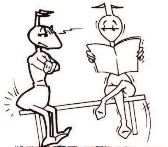
Comportement en "tête à tête"

Ce retour à l'unité passe par la reconnaissance de son profil dominant. Il s'agit d'apprendre à nommer mes schémas répétitifs à caractère cognitif et affectif, qui m'entraînent à être trop réactif par rapport à mon environnement. Une fois que j'ai pris acte de ma compulsion dominante, alors je peux progressivement prendre mes distances, renoncer à mon schéma automatique, et essayer d'utiliser des facettes de moi-même plus appropriées et plus justes. C'est une pratique quotidienne, semblable à celle de la méditation, que nous appelons " Développer l'observateur intérieur ". Il s'agit de constater de plus en plus tôt si je suis centré ou si je ne le suis pas, considérant qu'être centré, c'est vivre l'unité, ne serait-ce qu'un instant.