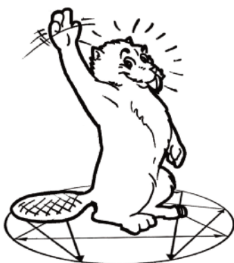
Base 3 : le Battant