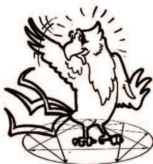
Base 4 : le Romantique