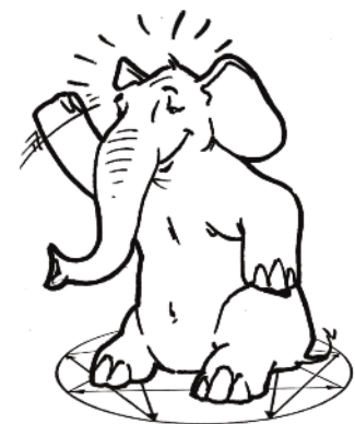
Base 9 : le Médiateur