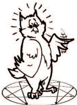
Base 5 : l'Observateur