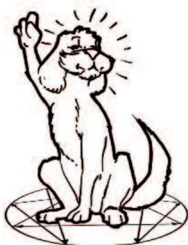
Base 2 : l'Altruiste