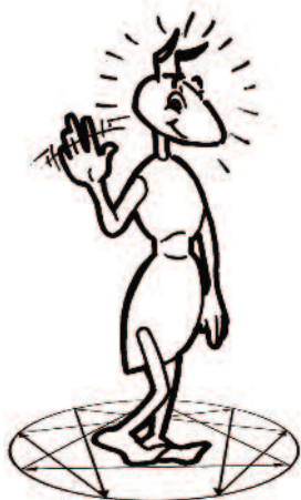
Base 1 : le Perfectionniste