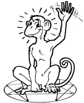
Base 7 : l'Épicurien