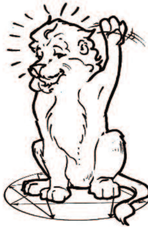
Base 8 : le Protecteur