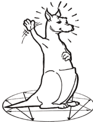
Base 6 : le Loyal-Sceptique

En base 9, nous trouvons un profil de type "passif-agressif" . Il préfère s'oublier lui-même et vivre en harmonie plutôt que de chercher à faire valoir son point de vue fermement. C'est un médiateur qui peut manquer d'affirmation de soi, mais qui sait écouter, trouver des consensus, faire en sorte que règne un climat constructif. En psychopathologie, on va trouver le passif-agressif .